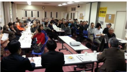
2月26日 花川南第2地区の様子