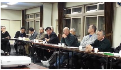
2月25日 白樺会館地区の様子