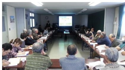
【花川北紅葉山地区】