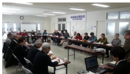
【花畔・緑苑台東地区】