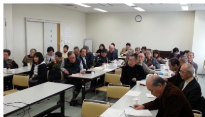
【花川北わかば地区】