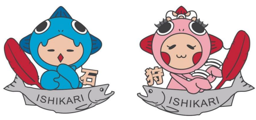
1個500円(寄付金含む) 詳しくはりんくる2階社協窓口へ。7月上旬より募金開始です!