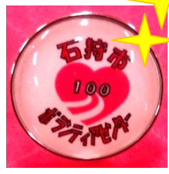
100回達成記念のピンバッジはハートの色が桃色です。

活動回数を見える形で表現することでやりがいや達成感を感じ、ボランティア活動の励みにしていただきたいと思います。なお、ボランティア活動が100回に達すると、ボランティアセンターオリジナルピンバッジをお渡しします。