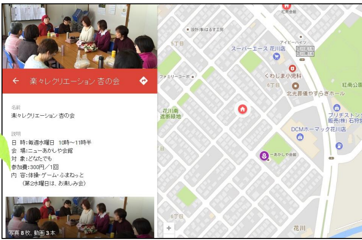
↑ネット版「通いの場まっぷ」

気もわかりやすくなっています。今回はサロンやサークルだけではなく、高齢者クラブなども記載しています。社協ホームページから、ぜひご覧ください!