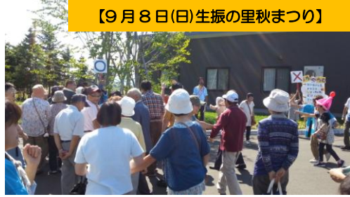
【9月8日(日)生振の里秋まつり】