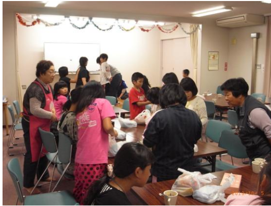
【10月5日(土)花川南地区社協様】 小学生対象の一泊研修の様子。夕食は役員さんの手作り♪町内会館に宿泊です。