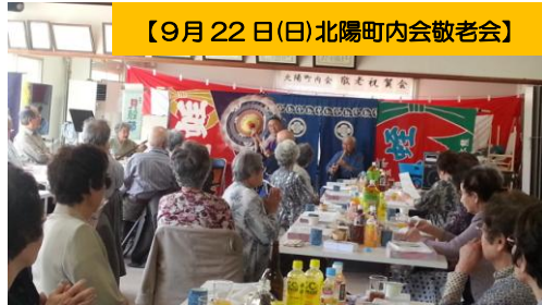
【9月22日(日)北陽町内会教会会】