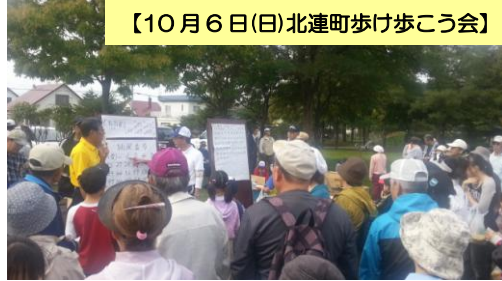
【10月6日(日)北連町歩け歩こう会】

《第4号》 石狩市社会福祉協議会 地域福祉課地域福祉係 発行 この壁新聞は、赤い羽根 共同募金の助成を受けて 作成しています。