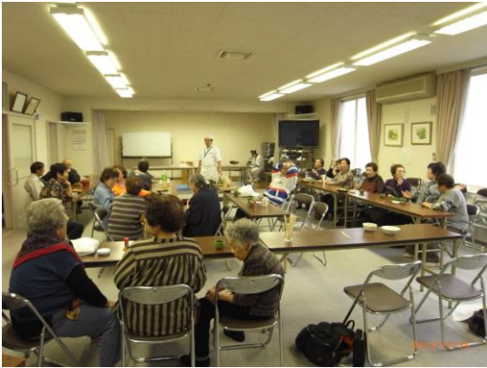
【10月26日(土)花川南第5地区社協様】 毎年好評の「そばの会」です。そば打ち同好会の方が手打ちそばを作ってくれます。

石狩市内では町内会や地区社協、サロンなどで様々な集まりが催されています。社会福祉協議会では、随時これらの活動にお邪魔させていただいており、今号ではその一部をご紹介します。