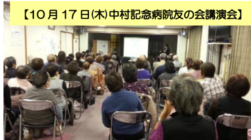
【10月17日(木)中村記念病院友の会講演会】