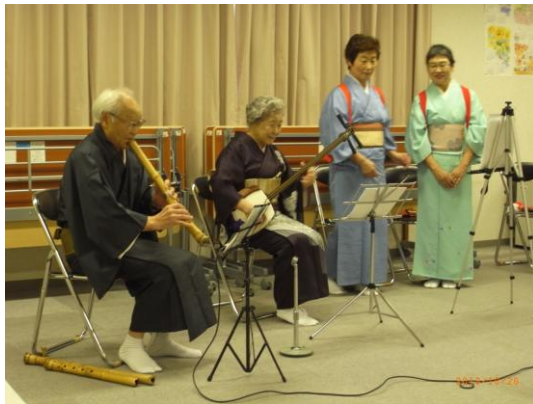
【10月26日(土)花川南第4地区社協様】 月1回、町内会館に集まって会食会をしています。食事後のレクが楽しみのひとつ。