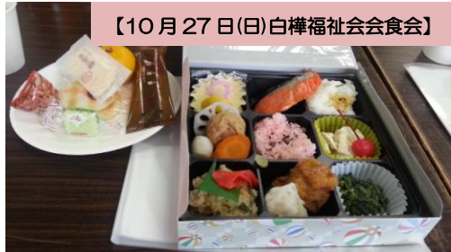
【10月27日(日)白樺福祉会会食会】