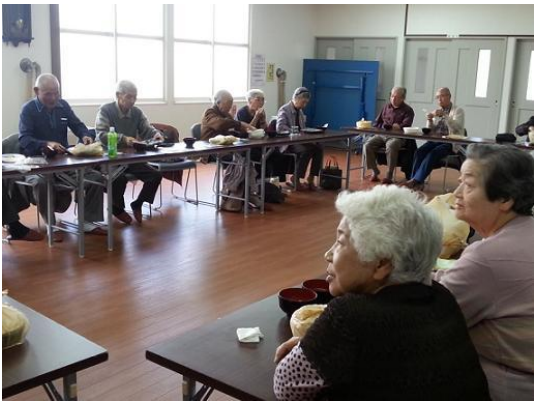
【10月17日(木)親船東地区社協様】 年3回行われる「ふれあい会食会」では、事前にメニューを選ぶことができます。