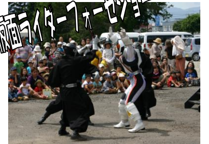
昨年度の様子です！！天候に恵まれた一日でした！！