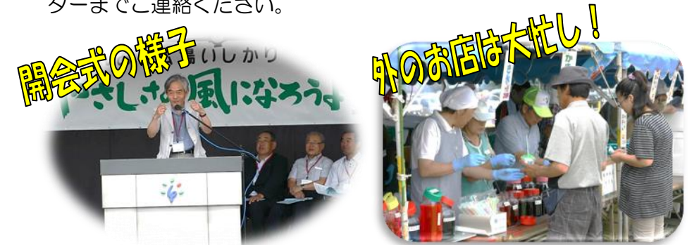
昨年度の様子です！天候にも恵まれ大勢の方がきてくれました！

ご協力いただける方は5月7日(水)までにボランティアセンターまでご連絡ください。