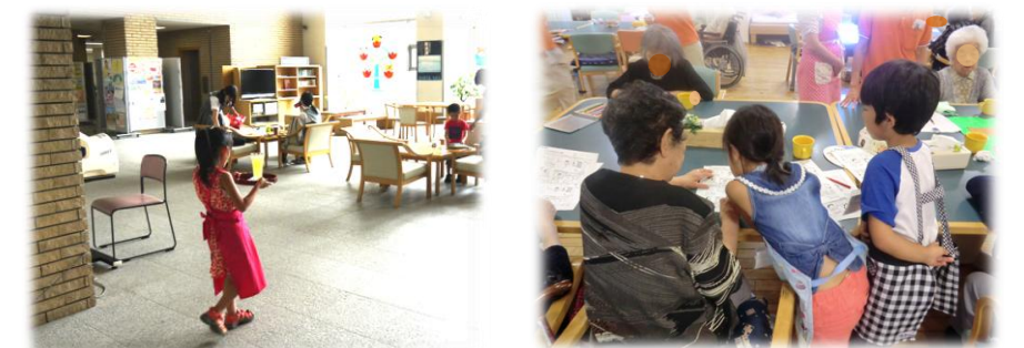
左)注文されたジュースをこぼさないように一生懸命に運んでいます。右)ティサービス利用者さんとお話を楽しんでいる子どもたちです。

夏休み期間中に、市内の小学生がボランティア体験をしました。りんくる来館者やティサービス利用者みなさまに、小さなボランティアの姿をみて優しく声をかけていただいたり、にこやかにしていただけて、参加してくれた子どもたちはとても喜んでいました。ボランティアの経験がこれからの生活に役立ってくれるとうれしいです。