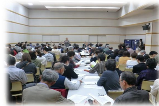
昨年(2018)の第1回実行委員会の様子

福祉のお祭り「ふれあい広場いしかり」が、今年も7月中旬に開催予定です。 毎年、多くのボランティアさんも実行委員会に参画され、福祉関係者の皆さんで作り上げるお祭り です。 第1回の実行委員会が下記のとおり開催されます。ボランティアとしてご協力いただける方は、直 接会場までお越しください。実行委員会は出席できなくても、「ふれあい広場」当日にご協力いただけ る方は、ボランティアセンターへご連絡ください。活動内容や担当委員会などをご相談させていただきます。 多くの皆様のご協力、お待ちしております!