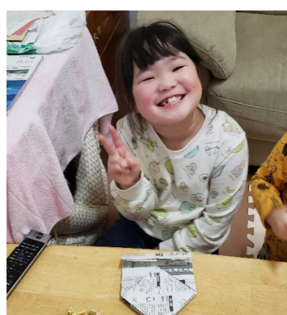
『チラシで箱づくり』