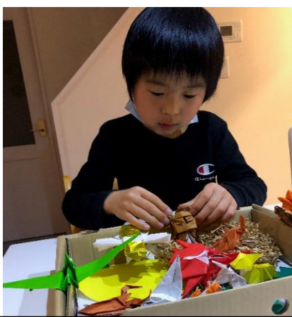
『折り紙などの作品展示』

今後も、コロナ禍での活動が続くと思いますが、できないとあきらめるのではなく、コロナ禍だからこそできる活動をもっとボランティアの皆様と一緒に考えていけたらと思いますので、よろしくお願いします。